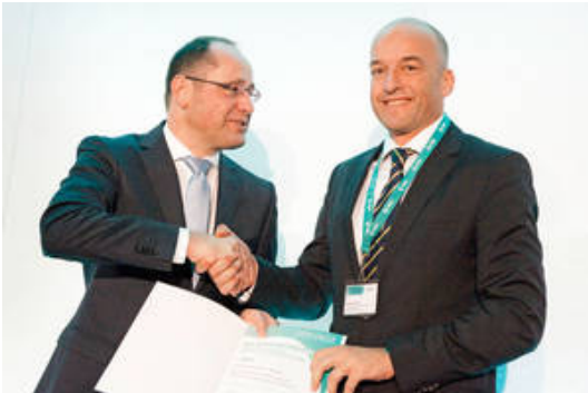
Prof. Steffen Ruchholtz (re) bei der Verleihung des MSD-Gesundheitspreises 2013.

Das von der Deutschen Gesellschaft für Unfallchirurgie (DGU) 2008 initiierte Projekt TraumaNetzwerk DGU® dient der Optimierung der Prozess- und Strukturqualität durch eine zertifizierte Vernetzung geprüfter Krankenhäuser einer Region, die regelhaft an der Versorgung Schwerverletzter teilnehmen. Darin eingebunden sind Rettungsdienste, Ärzte sowie kompetente Einrichtungen und Zentren zur Behandlung spezieller Verletzungsfolgen wie Schwerbrandverletzten-, Rückenmarksverletzten- und Replantationszentren. Entsprechend den die Versorgungsqualität sichernden Vorgaben der zweiten Auflage des Weißbuches werden zukünftig auch Einrichtungen zur Rehabilitation und ambulanten Weiterbehandlung in ein TraumaNetzwerk DGU® regelhaft integriert.